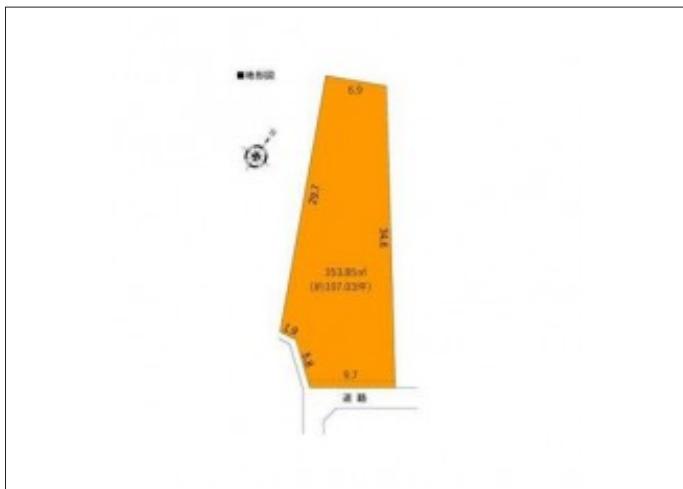
写真 107坪・更地渡し