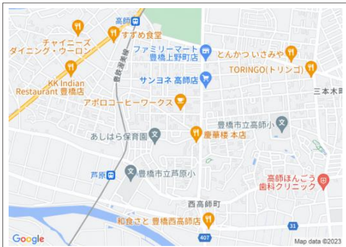
写真 渥美線「芦原」駅まで徒歩8分 サンヨネ近く買い物便利