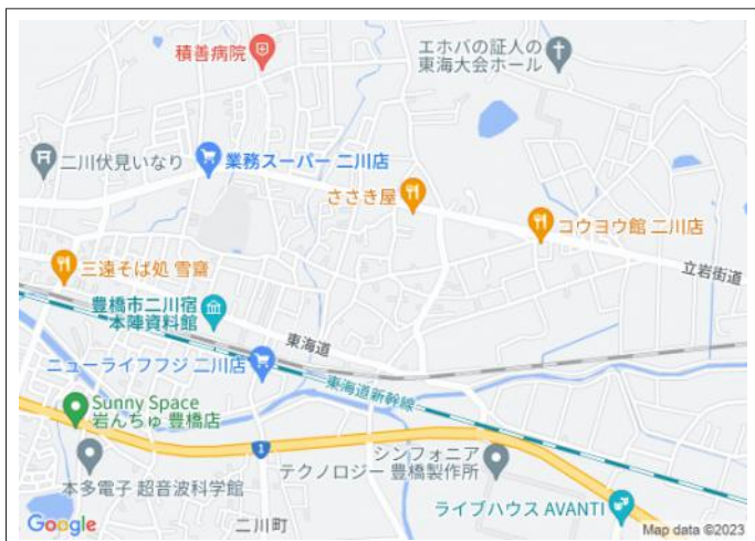
写真 建築条件なし