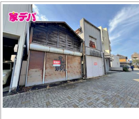
写真 建築条件無し