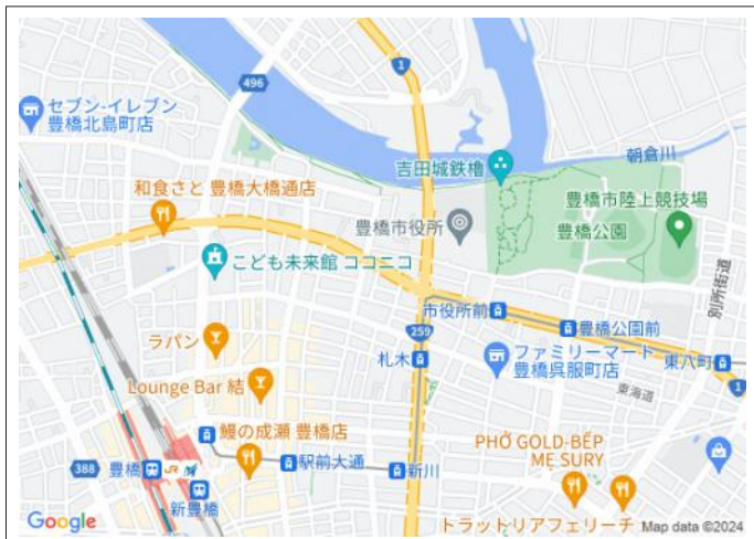
写真 東田本線「札木」駅まで徒歩5分!