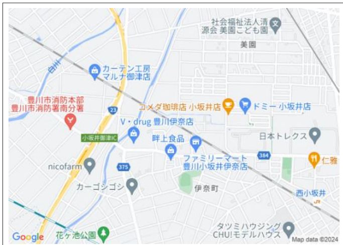
写真 「280坪」超! 更地引渡し! ドミー小坂井店まで徒歩10分で便利