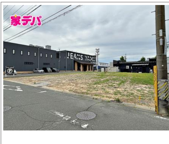
写真 1号地 図面と現況に相違がある場合は現況優先とします