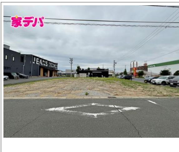
写真 2号地 図面と現況に相違がある場合は現況優先とします