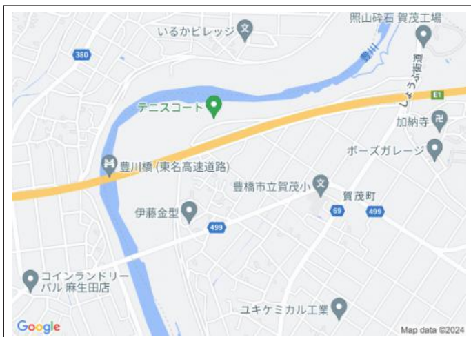
写真 図面と現況に相違ある場合には現況優先とします。