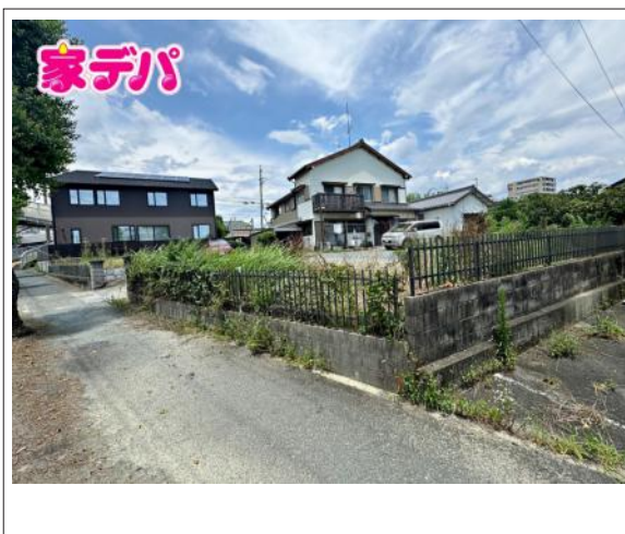
写真 図面と現況に相違ある場合には現況優先とします。