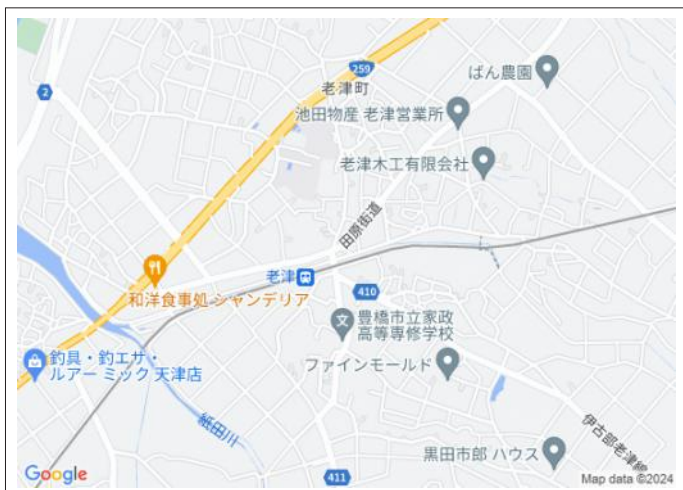
写真 老津小学校まで徒歩8分!お子様の通学も安心の立地です。建築条