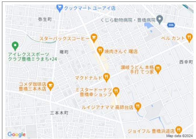
写真 生活に便利な商業施設が周辺に充実!