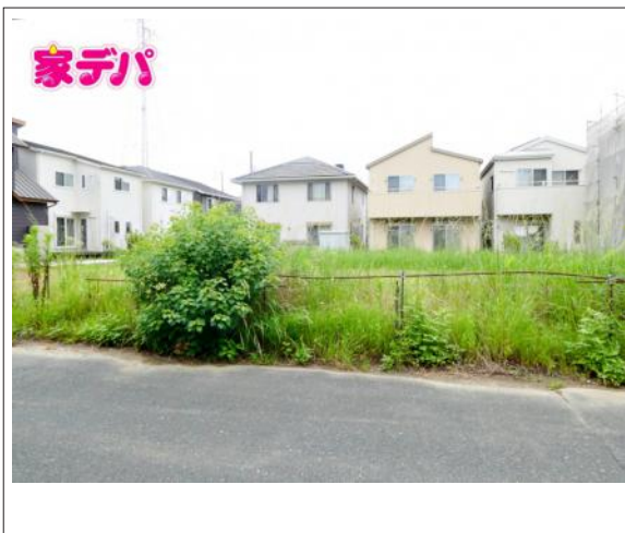
写真 図面と現況に相違ある場合には現況優先とします。