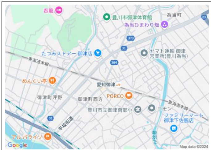
写真 東海道本線「愛知御津」駅まで徒歩3分!忙しい朝が助かる立地で