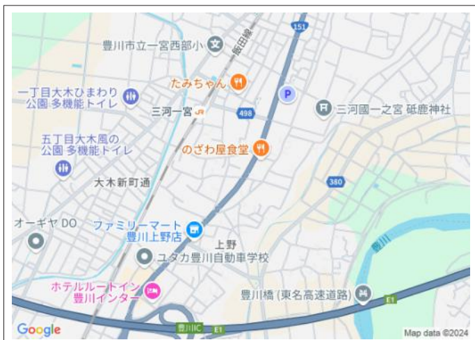
写真 図面と現況に相違ある場合には現況優先とします。