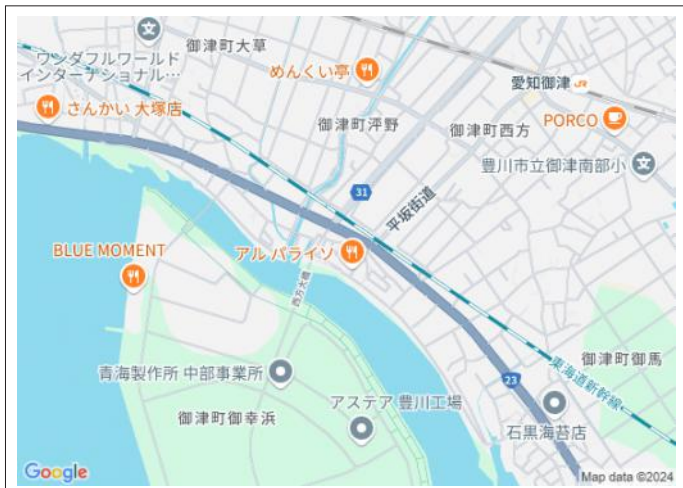
写真 845.86坪! 国道23号線へのアクセス良好