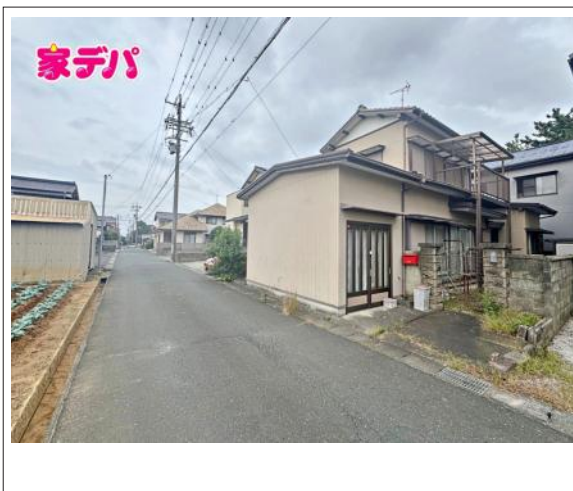
写真 図面と現況に相違ある場合には現況優先とします。