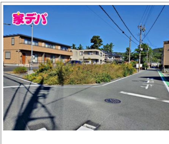
写真 図面と現況に相違ある場合には現況優先とします。