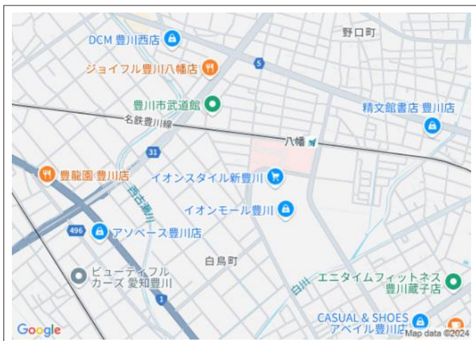
写真 名鉄豊川線「八幡」駅まで徒歩7分!イオンモールも徒歩5分の好立