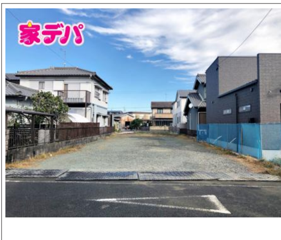
写真 図面と現況に相違ある場合には現況優先とします。