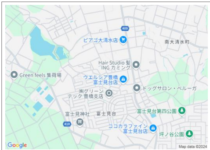
写真 建築条件はありません!お好きなハウスメーカーで建築可能!富士見