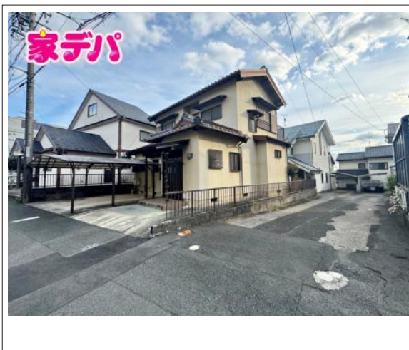
写真 図面と現況に相違ある場合には現況優先とします。