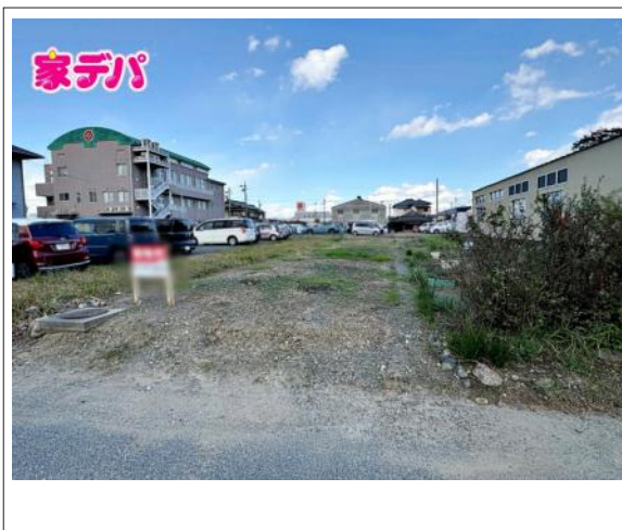
写真 建築条件なし