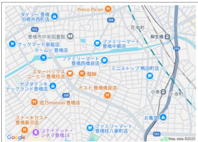
写真 建築条件はありません!周辺には公園やスーパーなど徒歩圏内に充