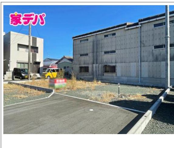
写真 3号地 図面と現況に相違ある場合には現況優先とします。