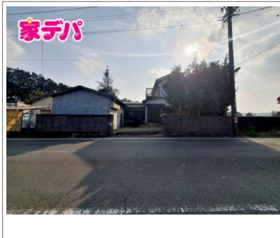
写真 【整形地】 図面と現況に相違ある場合には現況優先とします。