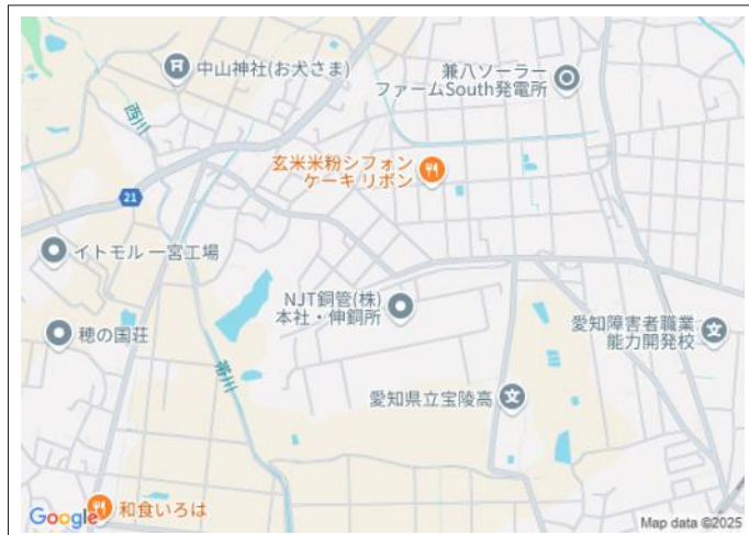
写真 敷地面積69坪超の整形地。国道151号線や高速インターへのカー