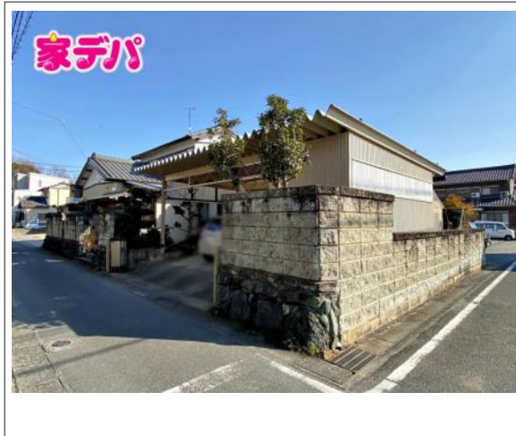
写真 図面と現況に相違ある場合には現況優先とします。