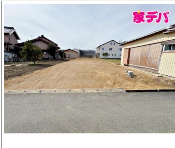
写真 図面と現況に相違ある場合には現況優先とします。