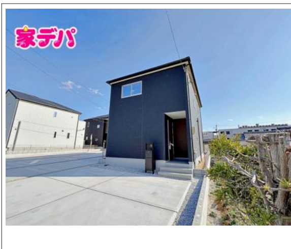
写真 【1号棟】完成しました! ・3LDK+2WIC