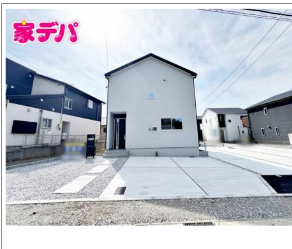
写真 【6号棟】完成しました! 4LDK+WIC