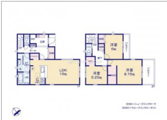
写真 【2号棟】完成予想図・3LDK・リビング16帖