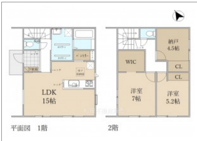
写真 【3号棟】上棟しました!・3LDK・リビング15帖