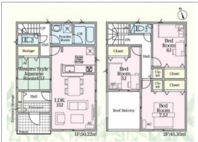
写真 【1号棟】完成予想図・4LDK・LDK15帖+隣接和室4.5帖