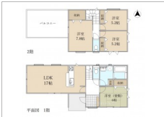
写真 【2号棟】 建築予定地です! ・4LDK ・リビング17帖