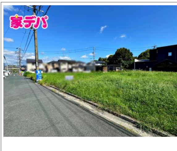
写真 4LDK 図面と現況に相違ある場合には現況優先とします。