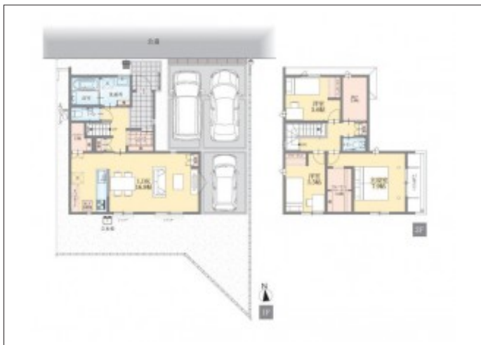
写真 【1号棟】 ご内覧可能です! ・3SLDK ・LDK16.8帖 ・納戸2.6帖