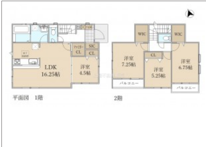
写真 【2号棟】 建築予定地です! ・4LDK ・LDK16.25帖、隣接洋室4.5帖