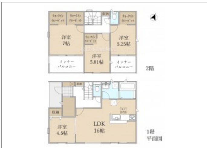
写真 【3号棟】完成予想図・4LDK・LDK16帖・土間収納