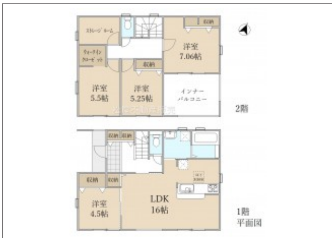
写真 【1号棟】完成予想図・4SLDK・LDK16帖