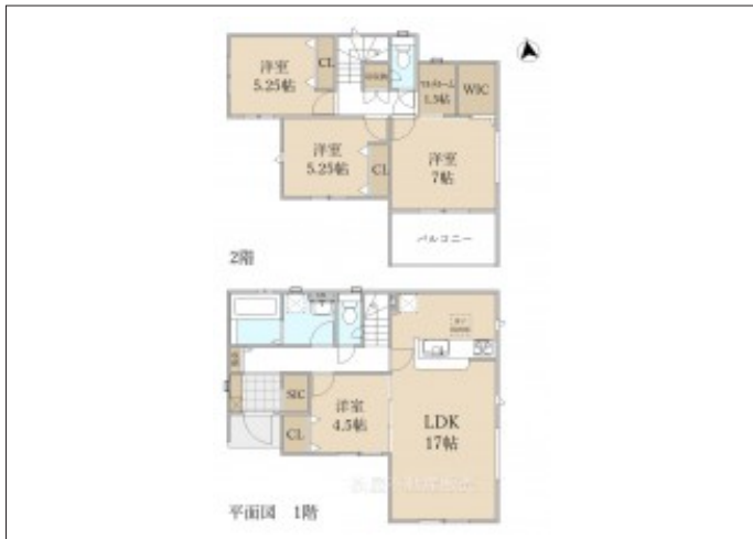
写真 【2号棟】 建築予定地です! ・4SLDK ・LDK17帖、隣接洋室4.5帖