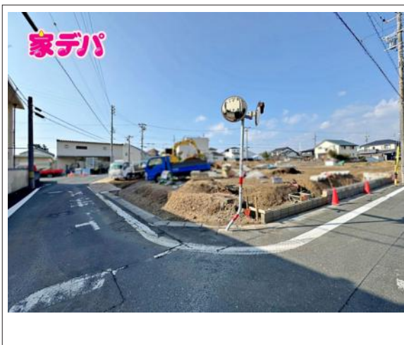
写真 【1号棟】建築予定地です!・平屋建て・角地・4LDK