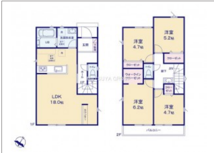
写真 【3号棟】建築予定地です! ・4LDK ・LDK18帖 ・全居室収納完備