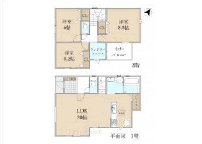
写真 3LDK 図面と現況に相違ある場合は現況優先とします。