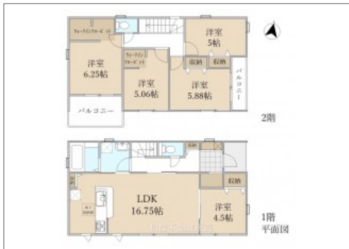
写真 5LDK 図面と現況に相違ある場合は現況優先とします。