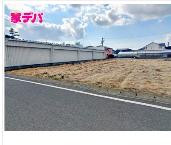
写真 4LDK 図面と現況に相違ある場合には現況優先とします。