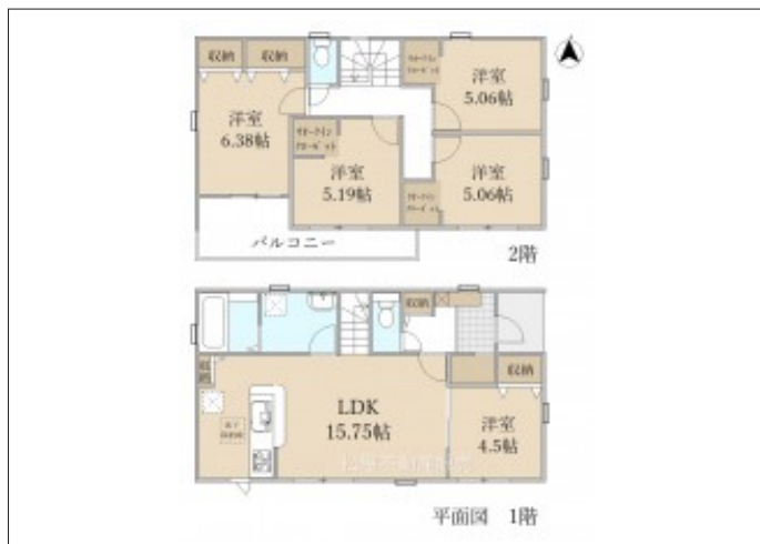
写真 【4号棟】 建築予定地です! ・整形地 ・長期優良住宅 ・5LDK