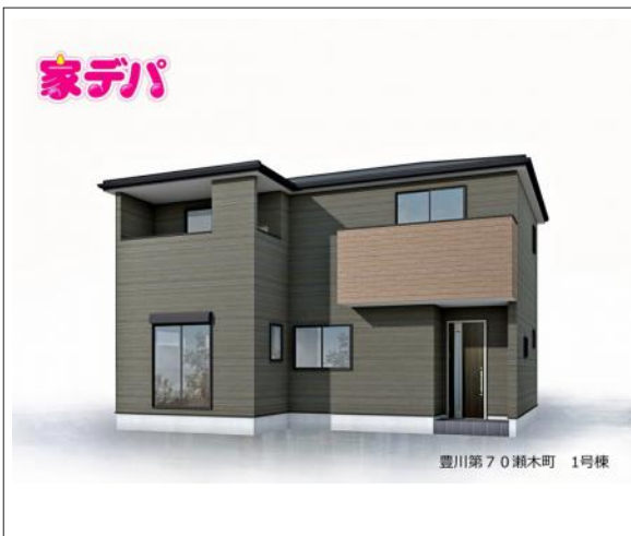
写真 5LDK 図面と現況に相違ある場合には現況優先とします。