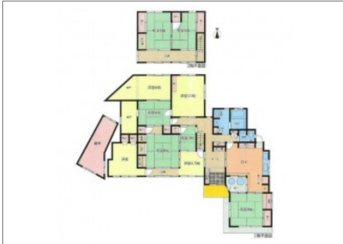
写真 敷地面積291坪!日当たり良好で家庭菜園や畑耕作ができます!