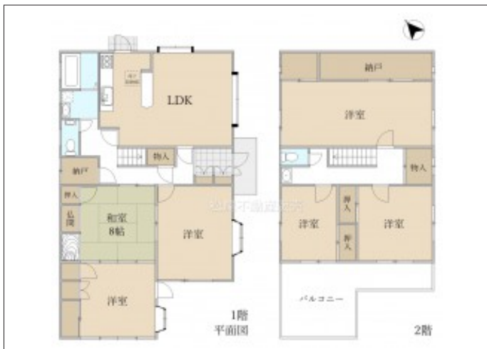
写真 部屋数豊富な6LDK!大家族でお住まいいただけます。2世帯同居も