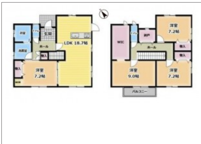
写真 敷地面積約40坪、主寝室にはウォークインクローゼット完備の「4