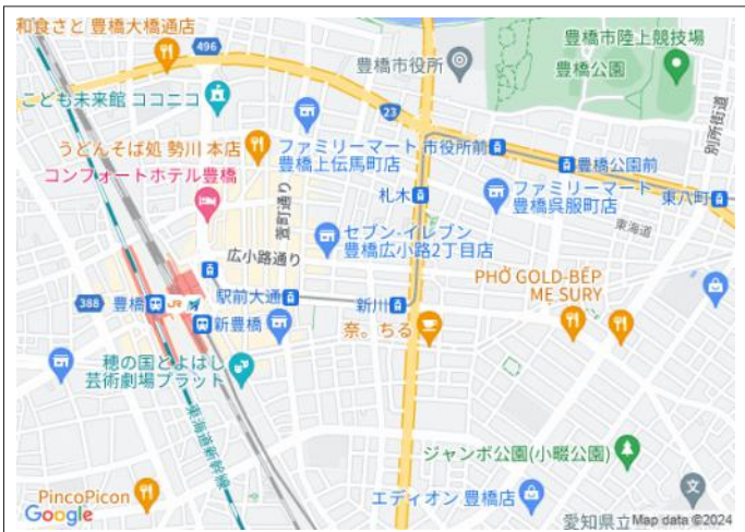
写真 豊橋鉄道東田本線「新川」駅徒歩3分です。通勤やお出かけに便利