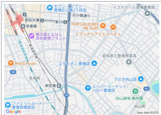
写真 豊橋鉄道渥美線「柳生橋」駅まで徒歩9分!通勤、通学にも便利で